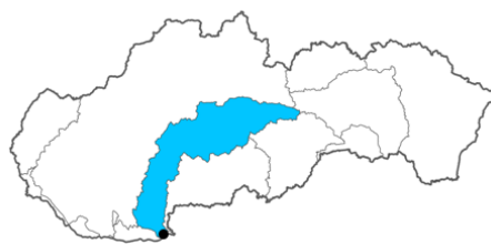
Obrázok 3. Mapa čiastkového povodia Hrona s vyznačením odberového miesta. Figure 3. Map of the Hron sub-basin with sampling site indication.