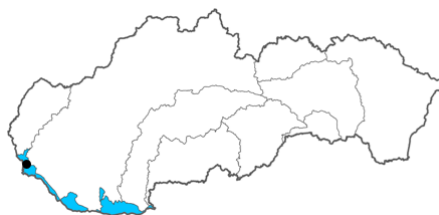
Obrázok 1. Mapka čiastkového povodia Dunaja s vyznačením odberového miesta.

In terms of the Watch list, Slovakia monitored all included substances in 2022 (Table 2). The frequency of monitoring was 4 times a year in 2022.