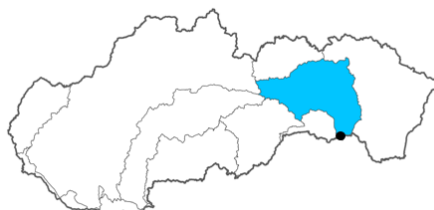
Obrázok 4. Mapa čiastkového povodia Hornádu s vyznačením odberového miesta. Figure 4. Map of the Hornad sub-basin with sampling site indication.