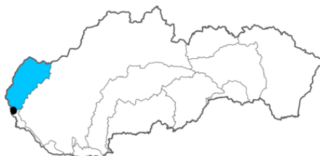
Obrázok 5. Mapa čiastkového povodia Moravy s vyznačením odberového miesta. Figure 5. Map of the Morava sub-basin with sampling site indication.

Na vybraných odberových miestach (Obrázok 1-5) sa predpokladá výskyt uvedených látok. Prístup k lokalitám je bezproblémový v každom ročnom období. Základné informácie o odberových miestach sú uvedené v Tabuľke 1.