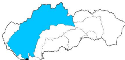
Obrázok 2. Mapka čiastkového povodia Váhu s vyznačením odberového miesta.

Figure 1. Map of the Danube sub-basin with sampling site indication.